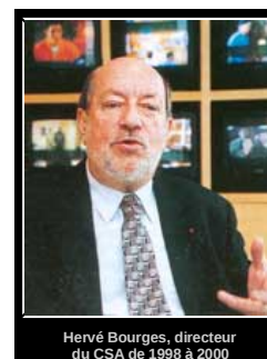
Hervé Bourges, directeur du CSA de 1998 à 2000